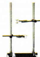
Suport cu clemă