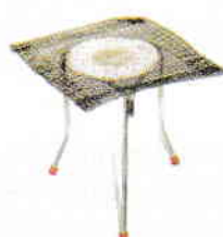
Trepied cu sită metalică cu inserție ceramică