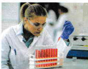
Ținuta în laborator: cu halat și părul strâns

Astăzi, această atitudine pare la fel de veche ca și alchimia. Dezvoltarea noilor tehnologii a dus la realizarea unor medii sigure și sănătoase în care înveți și lucrezi.