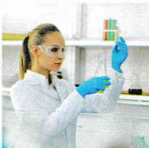
Execuția lucrării de laborator, stând în picioare