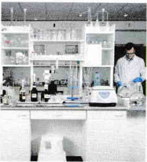
Laborator de chimie, astăzi