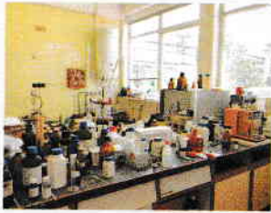
Laborator de chimie, cu câteva decenii în urmă