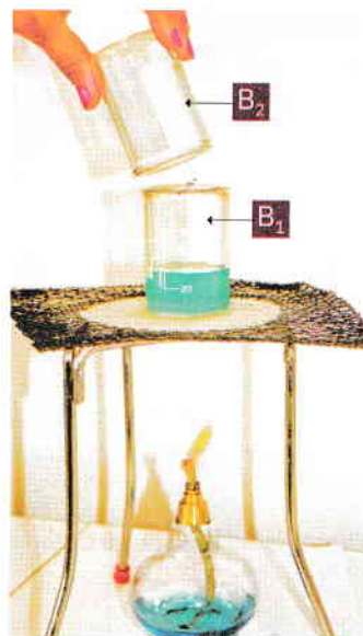
Instalația de încălzire a amestecului de apă și piatră-vânăță

Când vaporii de apă intră în contact cu paharul rece, B_2 , se observă formarea unor picături de apă pe pereții acestuia. Acest fenomen se numește condensare . În acest fel, apa care s-a evaporat din paharul B_1 a fost obținută, din nou, în stare lichidă, pe pereții paharului B_2 .