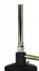
Bec de gaz