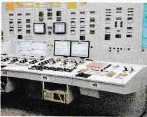
Laborator într-o centrală nucleară