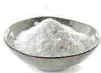
Sare de bucătărie

Exemple de substanțe anorganice: sare de bucătărie, apă, fier, dioxid de carbon, argint, aur etc.