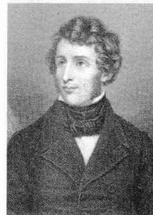
Friedrich Wöhler (1800 – 1882)

Termenul de chimie organică a fost folosit pentru prima dată de Jakob Berzelius, în tratatul său de chimie (1808). Pionierul chimiei organice este considerat, totuși, chimistul german Friedrich Wöhler, care în anul 1828 obține pentru prima oară în laborator ureea , o substanță produsă în organismele animale. Până atunci se credea că substanțele organice se pot forma în corpul animalelor și plantelor doar sub influența „forței vitale”, o forță de origine divină. El a demonstrat că această teorie este falsă, atunci când a preparat artificial ureea (substanță organică), folosind numai substanțe anorganice.