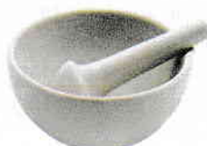
Mojar cu pistil